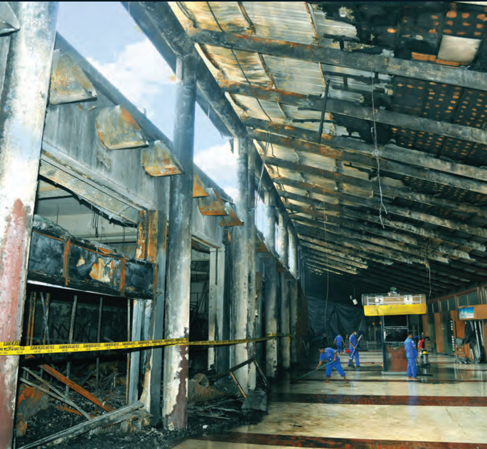
Kunjungan Kerja Spesifik ke Bandara Soekarno - Hatta, Komisi V DPR RI meakukan Kunjungan Kerja Spesifik ke Bandara Soekarno - Hatta terkait terbakarnya Terminal 2E Bandara Soekarno-Hatta 06 Juli 2015