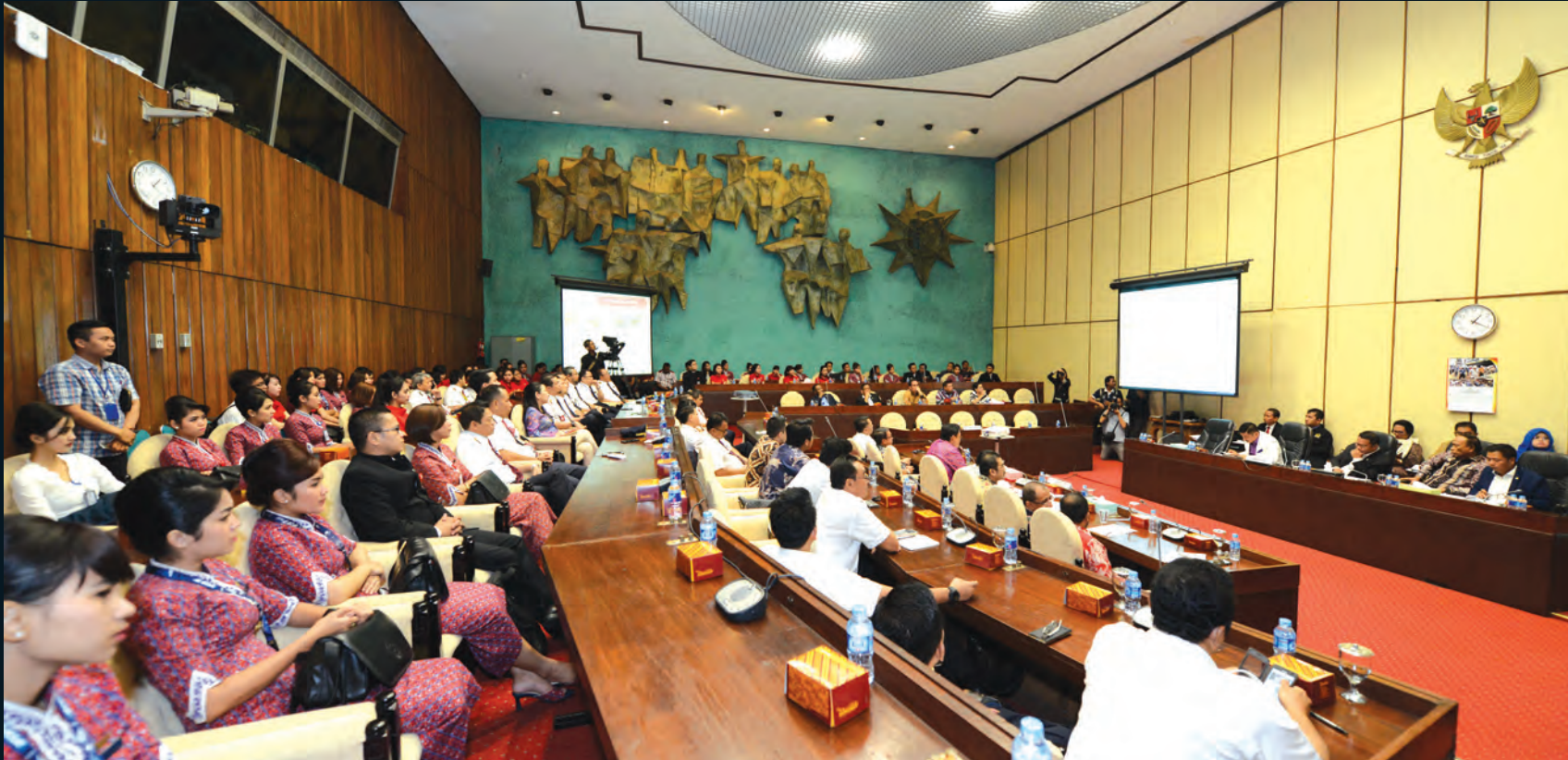
Raker Komisi V 2016 Rapat dengar pendapat umum dengan manajemen dan karyawan Lion Air 05 Maret 2016