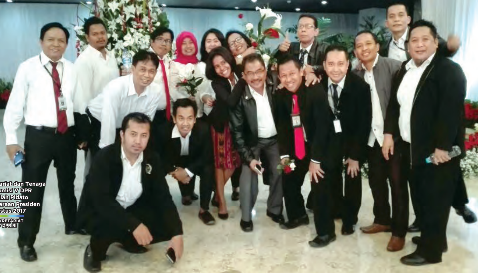
Sekretariat dan Tenaga Ahli Komisi V DPR RI setelah Pidato Kenegaraan Presiden 16 Agustus 2017