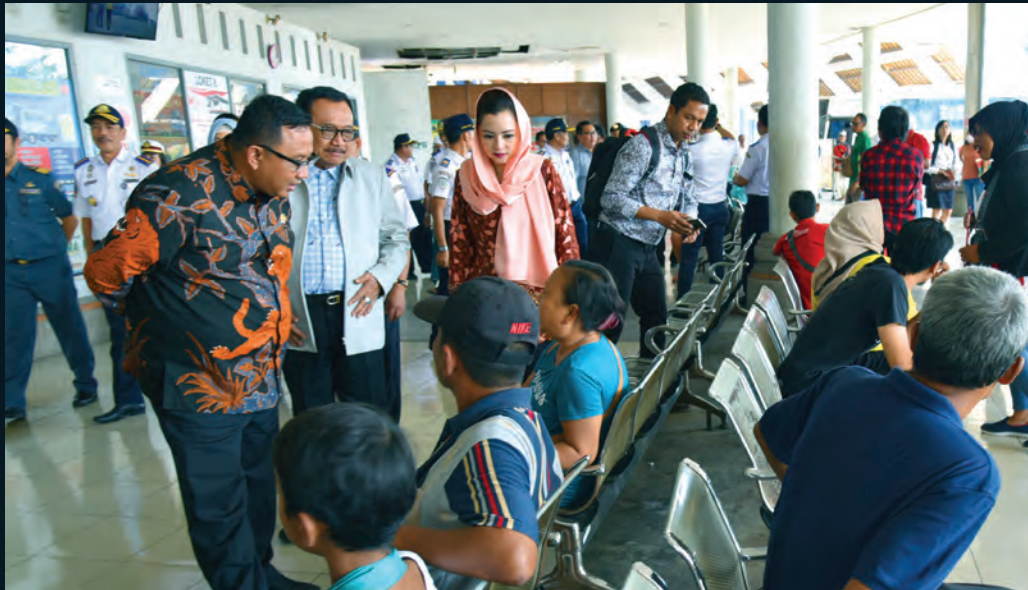
Pimpinan Komisi V DPR RI Anton Sukartono Suratno berbincang dengan penumpang dalam kunjungan di Terminal Bus di Bali terkait dengan liburan lebaran 2018 31 Mei 2018