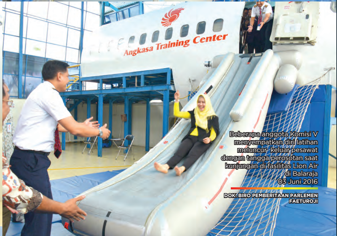
Beberapa anggota Komisi V menyempatkan diri latihan meluncur keluar pesawat dengan tangga perosotan saat kunjungan di fasilitas Lion Air di Balaraja 03 Juni 2016