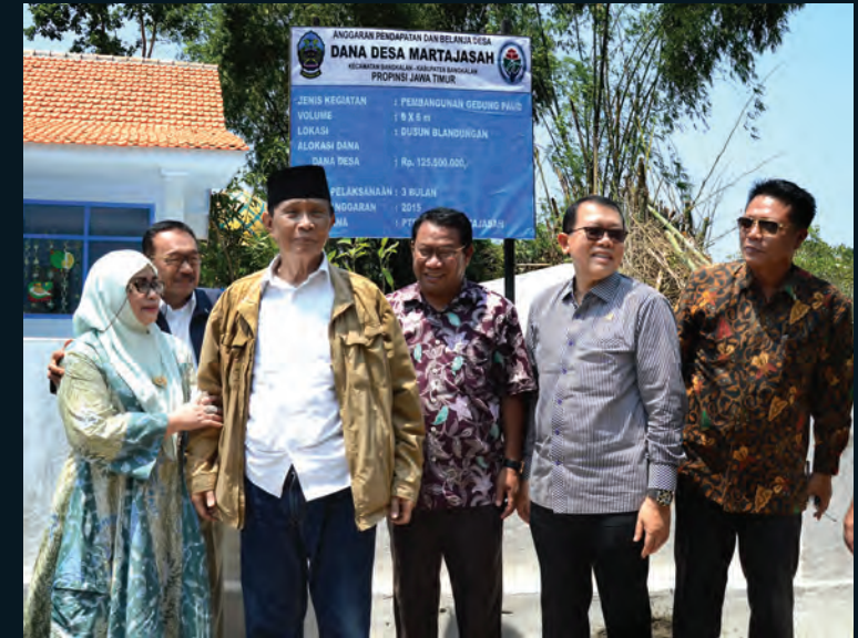
Kunjungan Kerja Komisi V 2016 Kunjungan Spesifik Komisi V DPR RI Dalam Rangka Peninjauan Pelaksanaan Pembangunan Dan Pemberdayaan Masyarakat Desa ke Kabupaten Bangkalan, Pulau Madura, Provinsi Jawa Timur 07-08 Maret 2016