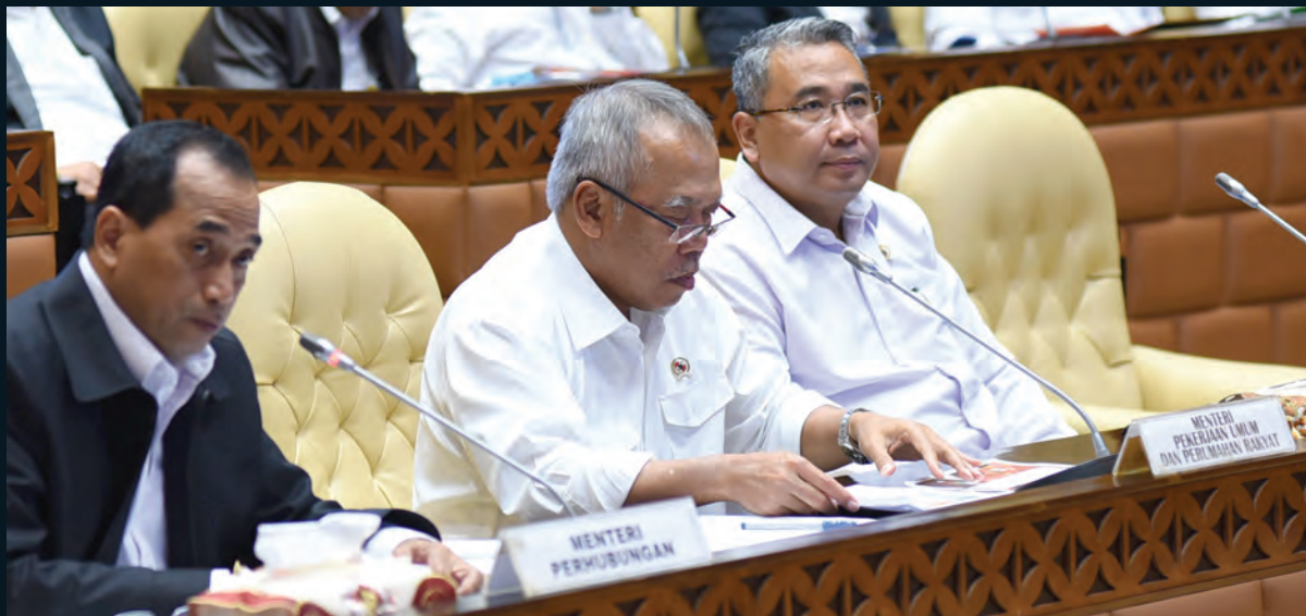
Rapat Kerja Komisi V DPR dengan Kemenhub, Kementerian PUPR, Menteri Desa, Pembangunan Daerah Tertinggal dan Transmigrasi, terkait Rencana Kerja dan Anggaran Kementerian Tahun Anggaran 2019 05 Juni 2018