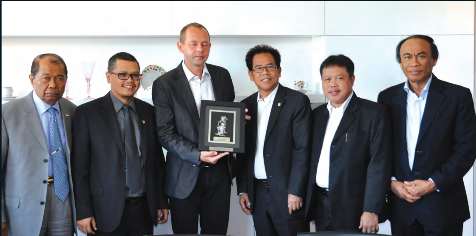
Kunjungan Kerja ke Republik Ceko dalam rangka pembahasan RUU tentang Arsitek