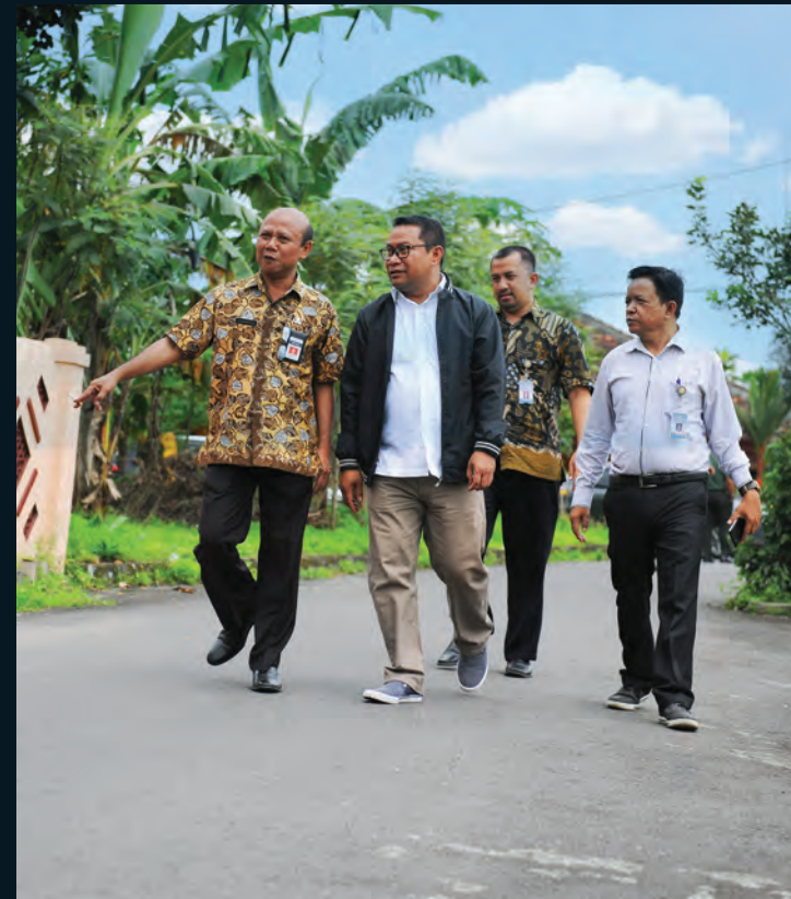
Komisi V Kunspek ke Magelang, Jateng\Peninjauan Calon Lokasi Rusunawa Wates 11 January 2018