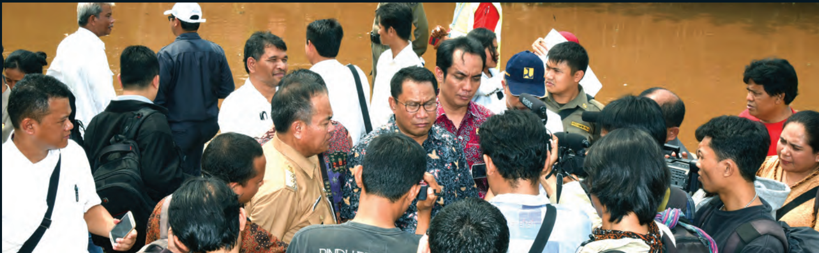
Kunjungan Kerja ke Wilayah Jakarta Komisi V DPR RI melakukan Kunjungan Kerja di Wilayah DKI Jakarta terkait penanganan Banjir Ibukota 07 Desember 2015