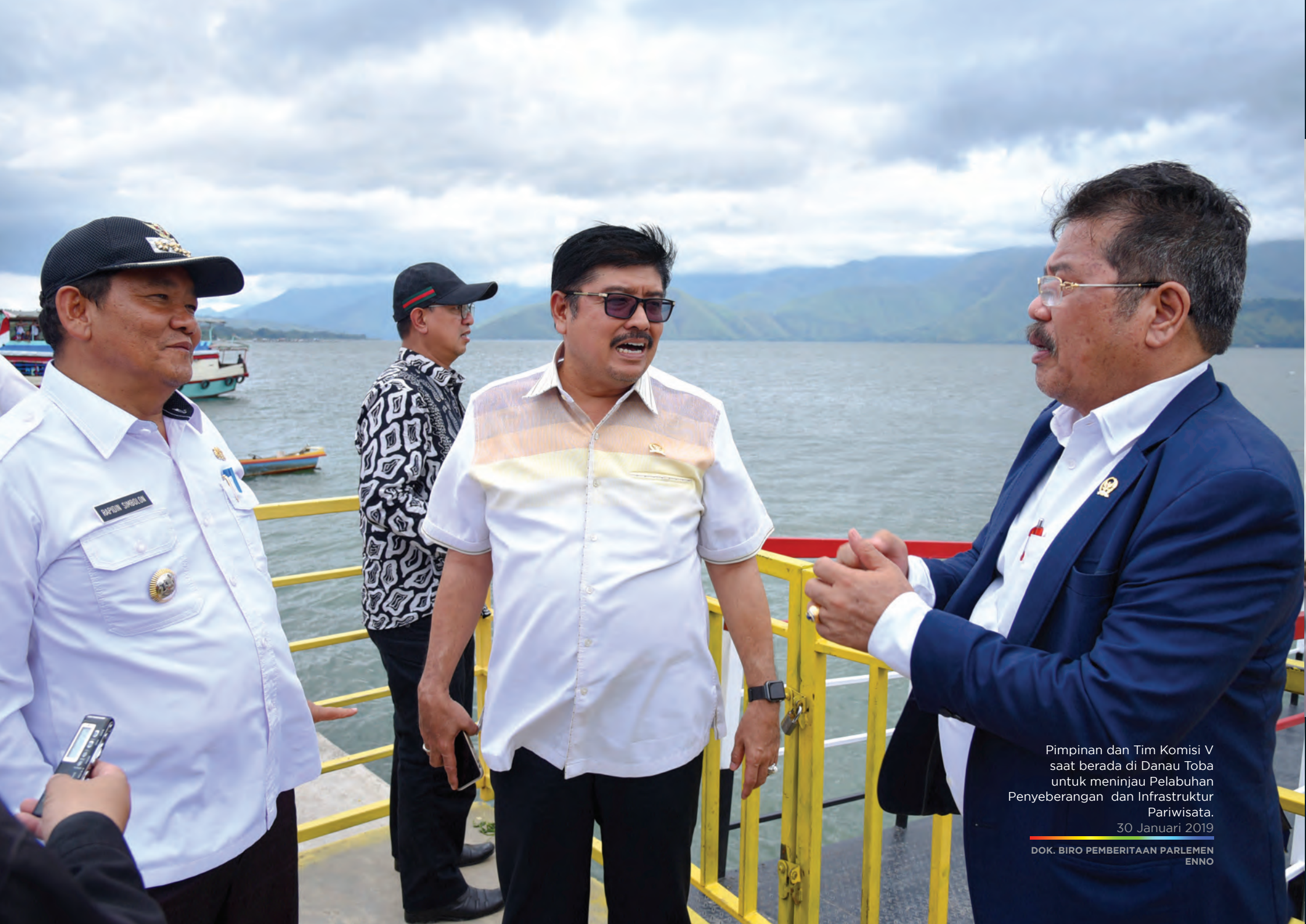
Pimpinan dan Tim Komisi V saat berada di Danau Toba untuk meninjau Pelabuhan Penyeberangan dan Infrastruktur Pariwisata.