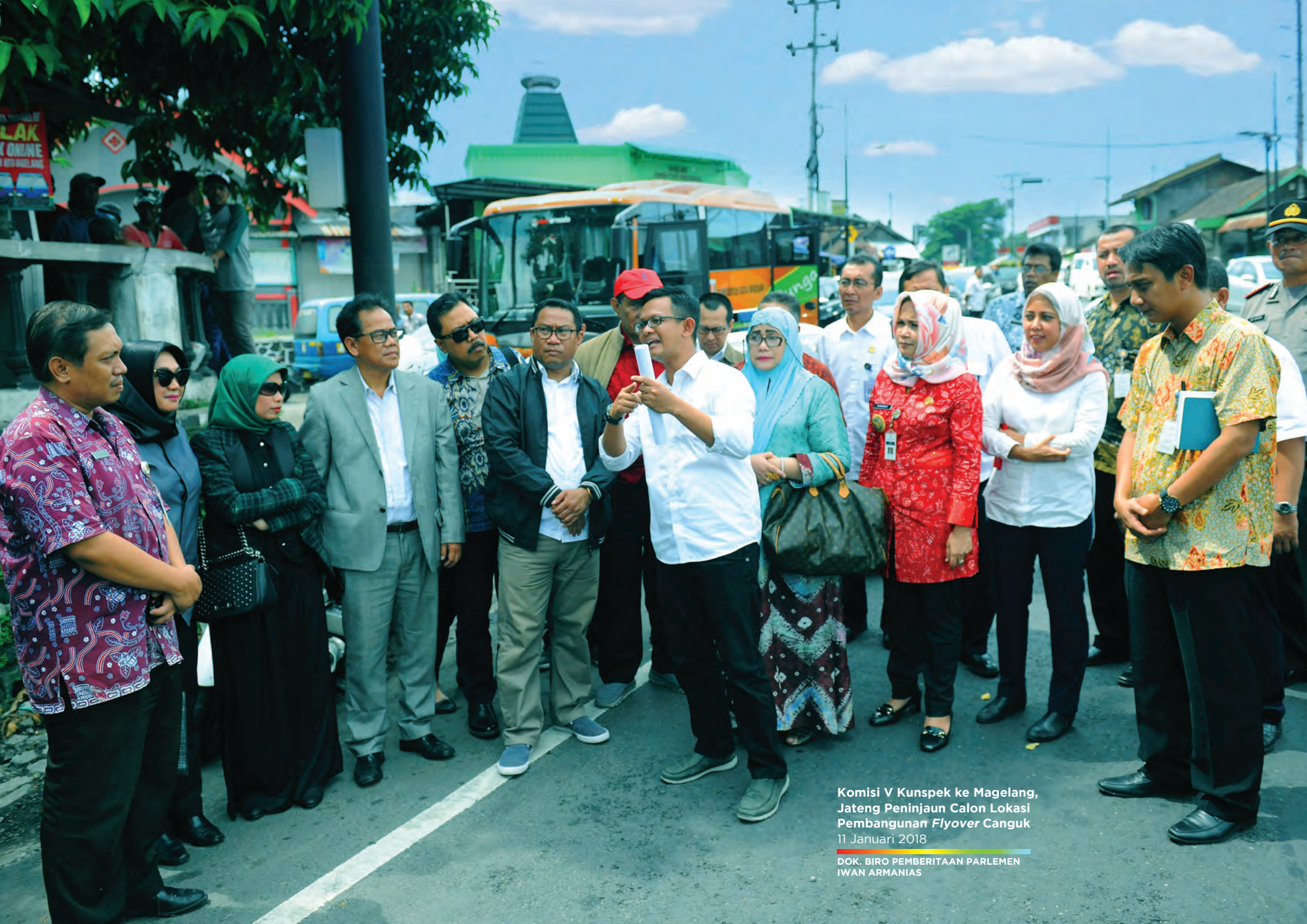
Komisi V Kunspek ke Magelang, Jateng Peninjaun Calon Lokasi Pembangunan Flyover Canguk 11 Januari 2018