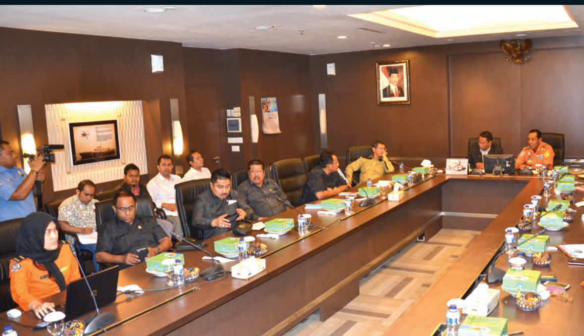
Kunfik Basarnas (Panja Penerbangan) Kunjungan Kerja Ke Basarnas dalam rangka pencarian dan pertolongan musibah Air Asia 20 Januari 2015