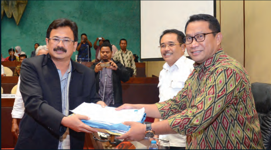
Rapat Komisi V DPR RI Komisi V DPR RI menerima Anggota DPRD Bandung terkait pembuatan jalur Kereta API Jakarta-Bandung 09 Februari 2017