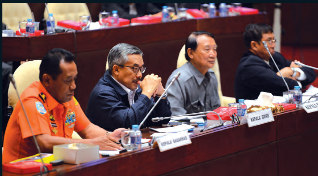
Raker Komisi V 2016 RDP Komisi V DPR RI dengan Kepala basarnas, BMKG, BPLS, BPWS terkait kinerja 05 September 2017