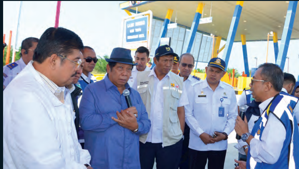
Tim Komisi V DPR RI ketika berkunjung ke Pematangsiantar Sumatera Utara. 7 Februari 2019