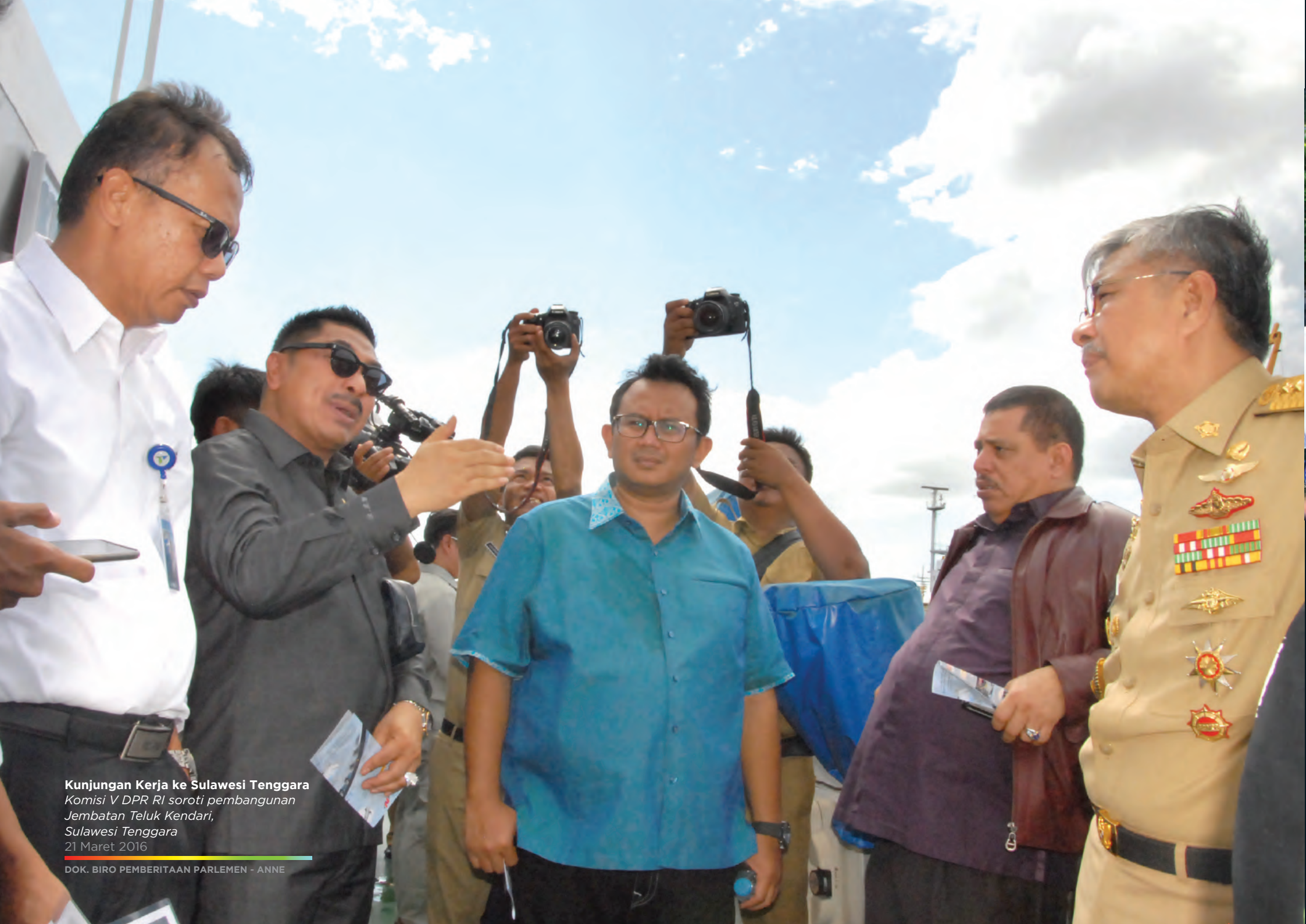
Kunjungan Kerja ke Sulawesi Tenggara Komisi V DPR RI soroti pembangunan Jembatan Teluk Kendari, Sulawesi Tenggara 21 Maret 2016