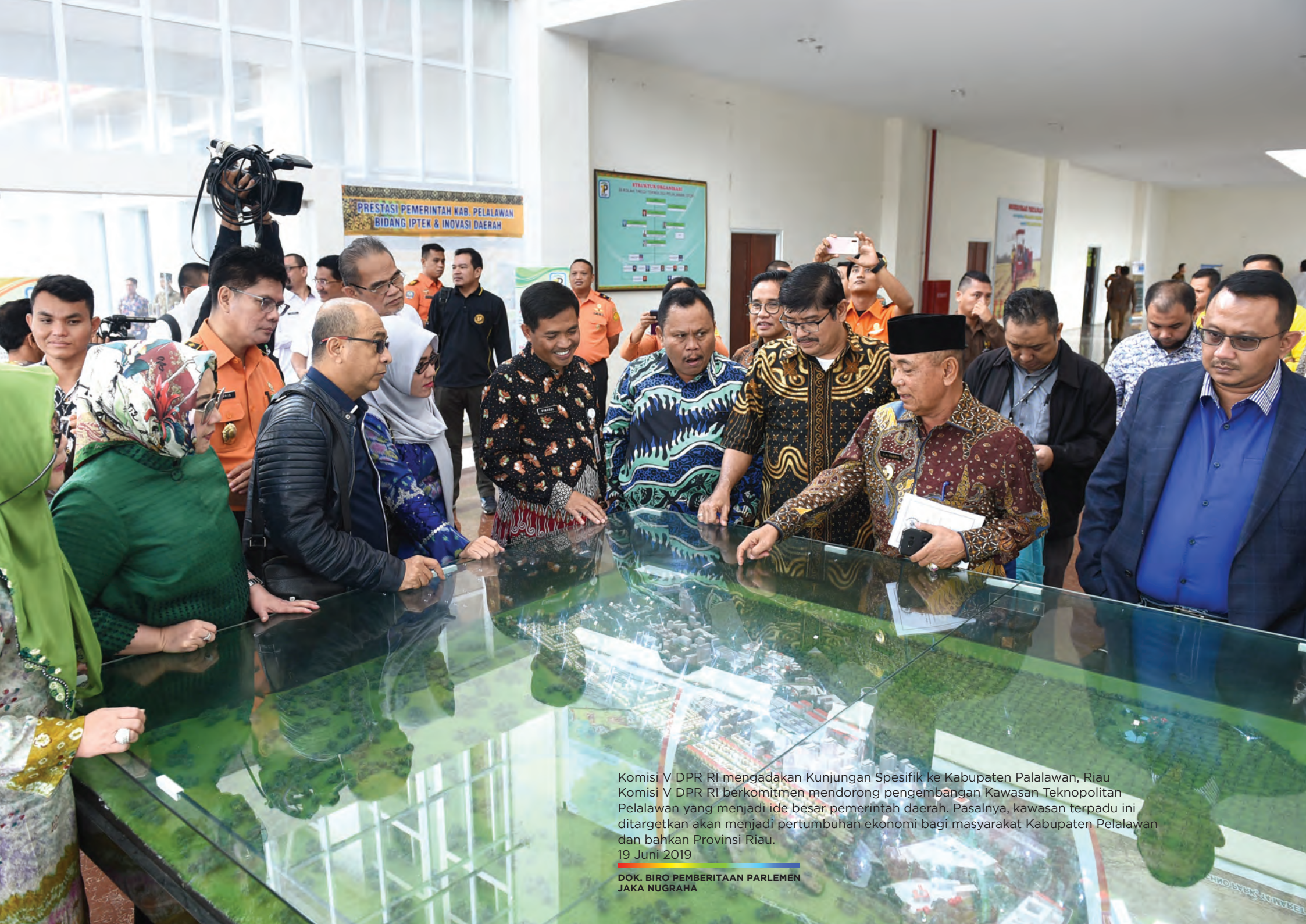
Komis V DPR RI mengadakan Kunjungan Spesifik ke Kabupaten Palawan, Riau Komis V DPR RI berkomitmen mendorong pengembangan Kawasan Teknopoliitan Pelalawan yang menjadi ide besar pemerintah daerah. Pasalnya, kawasan terpadu ini ditargetkan akan menjadi pertumbuhan ekonomi bagi masyarakat Kabupaten Pelalawan dan bahkan Provinsi Riau. 19 Juni 2019