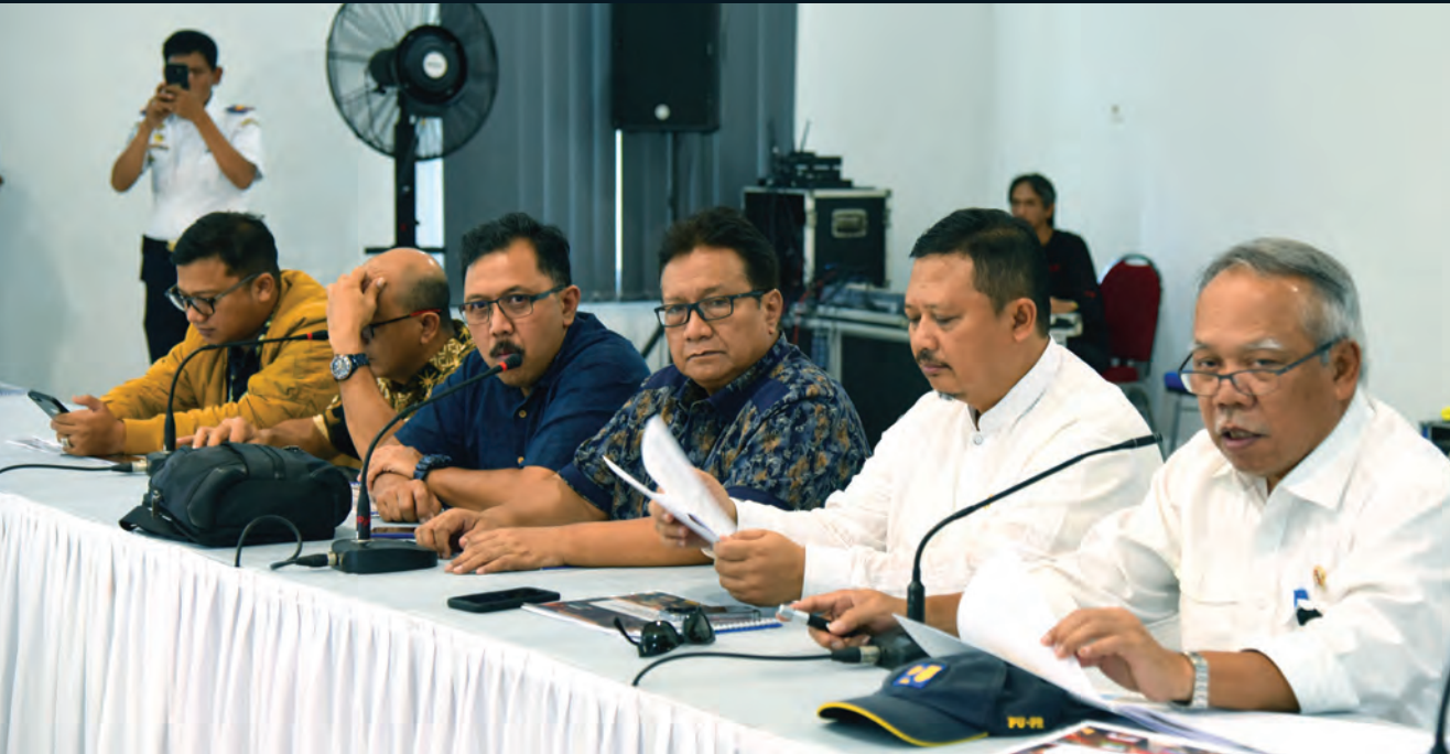
Tim Kunjungan Komisi V dalam rangka persiapan infrastruktur dan angkutan Lebaran 2019 melakukan kunjungan bersama dengan Menteri PUPR 23 Mei 2019