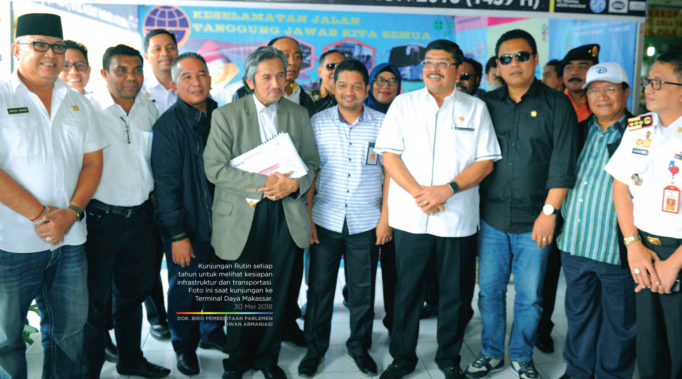
Kunjungan Rutin setiap tahun untuk melihat kesiapan infrastruktur dan transportasi. Foto ini saat kunjungan ke Terminal Daya Makassar. 30 Mei 2018