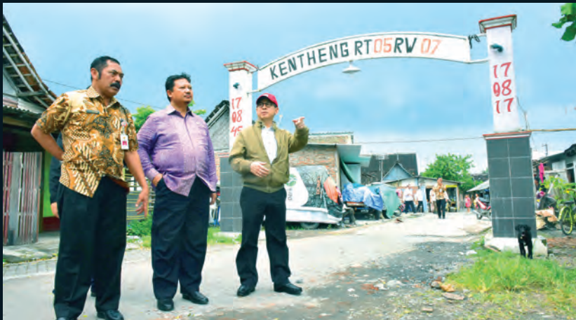
Kunspek Komisi V ke Solo Kufik Solo. Jawa Tengah Komisi V DPR RI Pintu Air Demangan, penataan kawasan Kenteng di Kelurahan Semanggi di Solo. 06-08 Februari 2018