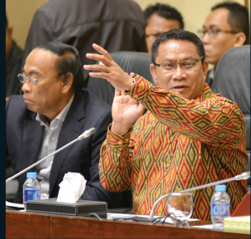
Raker Komisi V 2016 Komisi V DPR RI Rapat Kerja Kemenpupr, Menkumham, Mendagri tentang Panja RUU jasa konstruksi 16 Maret 2016