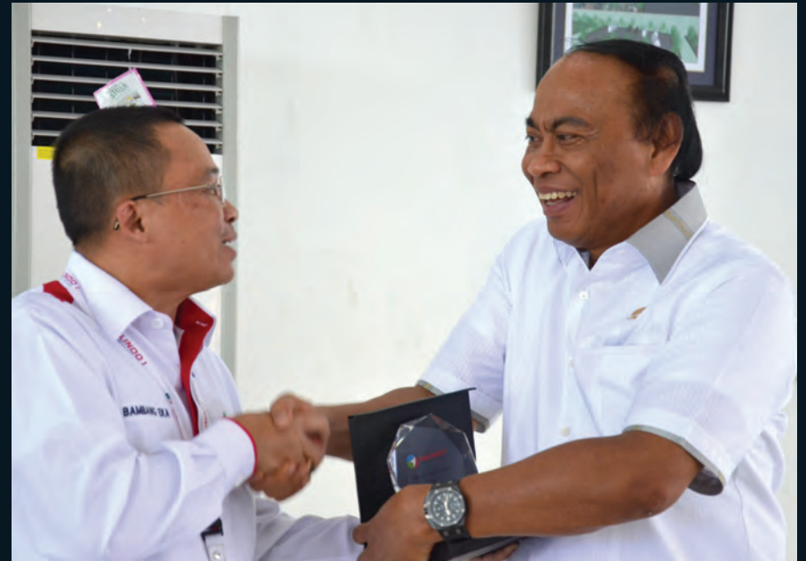
Kunspek Sumatera Utara Kunjungan spesifik Komisi DPR RI dalam rangka peninjauan infrastruktur dan transportasi Natal 2015 dan tahun baru 2016 di Sumatera Utara 7-12 Desember 2015