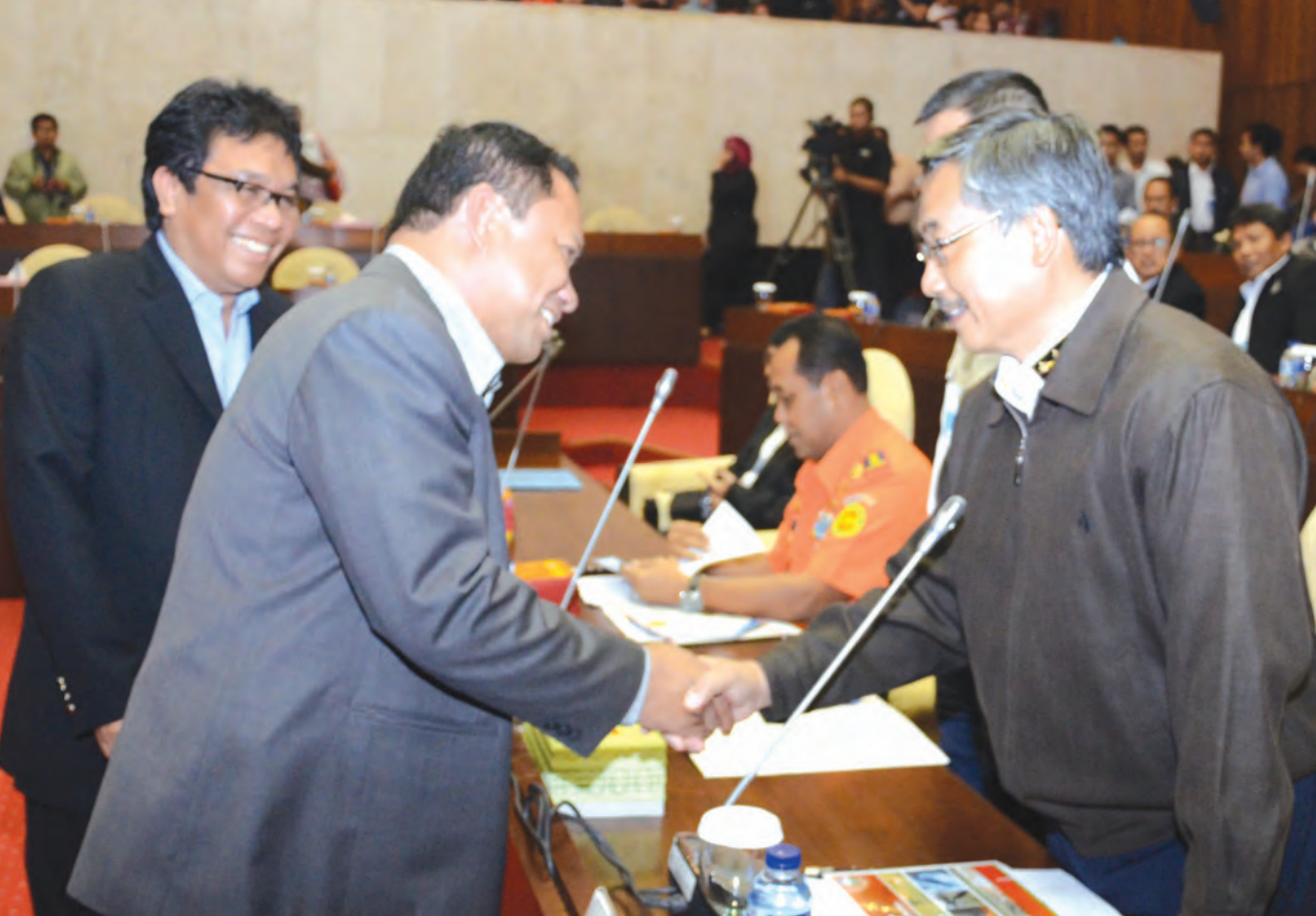
Rapat Kerja dengan Menteri Perhubungan Ignatius Jonan Ketua Komisi V DPR RI menyalami salah satu pejabat mitra saat Raker dengan Menteri Perhubungan terkait dengan musibah Air Asia 20 Januari 2015