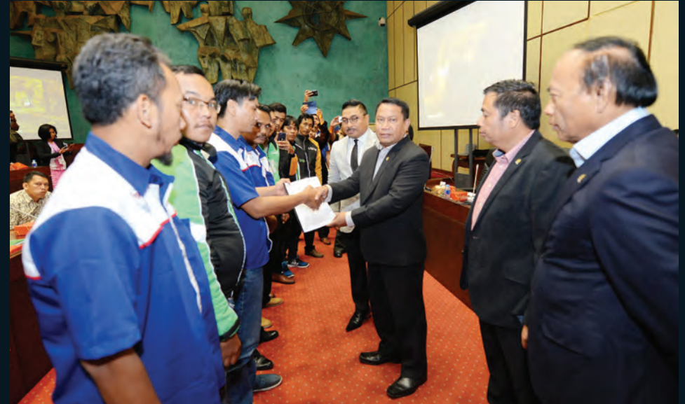
Rapat Komisi Audiensi dengan asosiasi driver online terkait permasalahan aplikasi angkutan online 29 Maret 2017