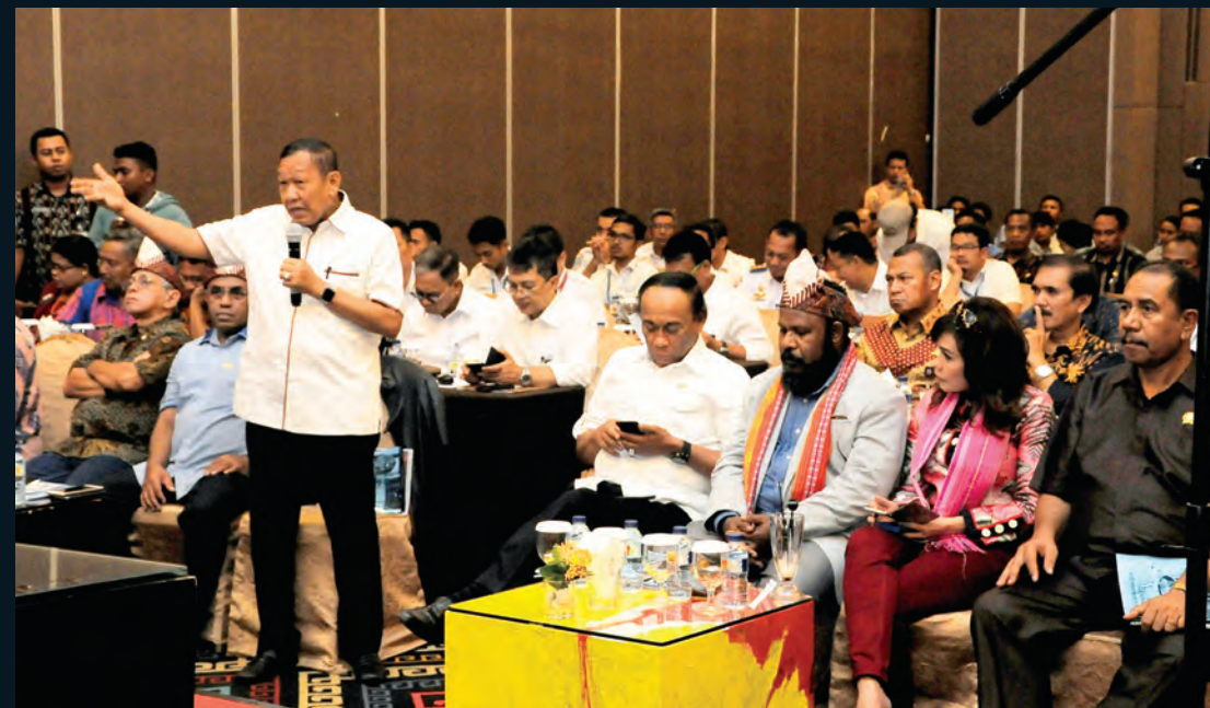
Komisi V DPR RI Kunjer ke Prov. Nusa Tenggara Timur Dalam kunjungan ke NTT, Ketua Komisi V DPR RI bersama Dirjen Sumber Daya Air (SDA) Kementerian PUPR meresmikan breakwater di Pantai Namosain serta menggelar Forum Diskusi Infrastruktur Kota Kupang. 26-28 Oktober 2017