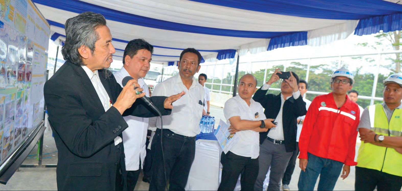
Kunjungan Kerja Spesifik Komisi V DPR RI ke Kalimantan Timur Kunjungan ini terkait dengan Panja Transportasi Darat, Preservasi Jalan Nasional dan Jembatan Panjang. 30 November 2017