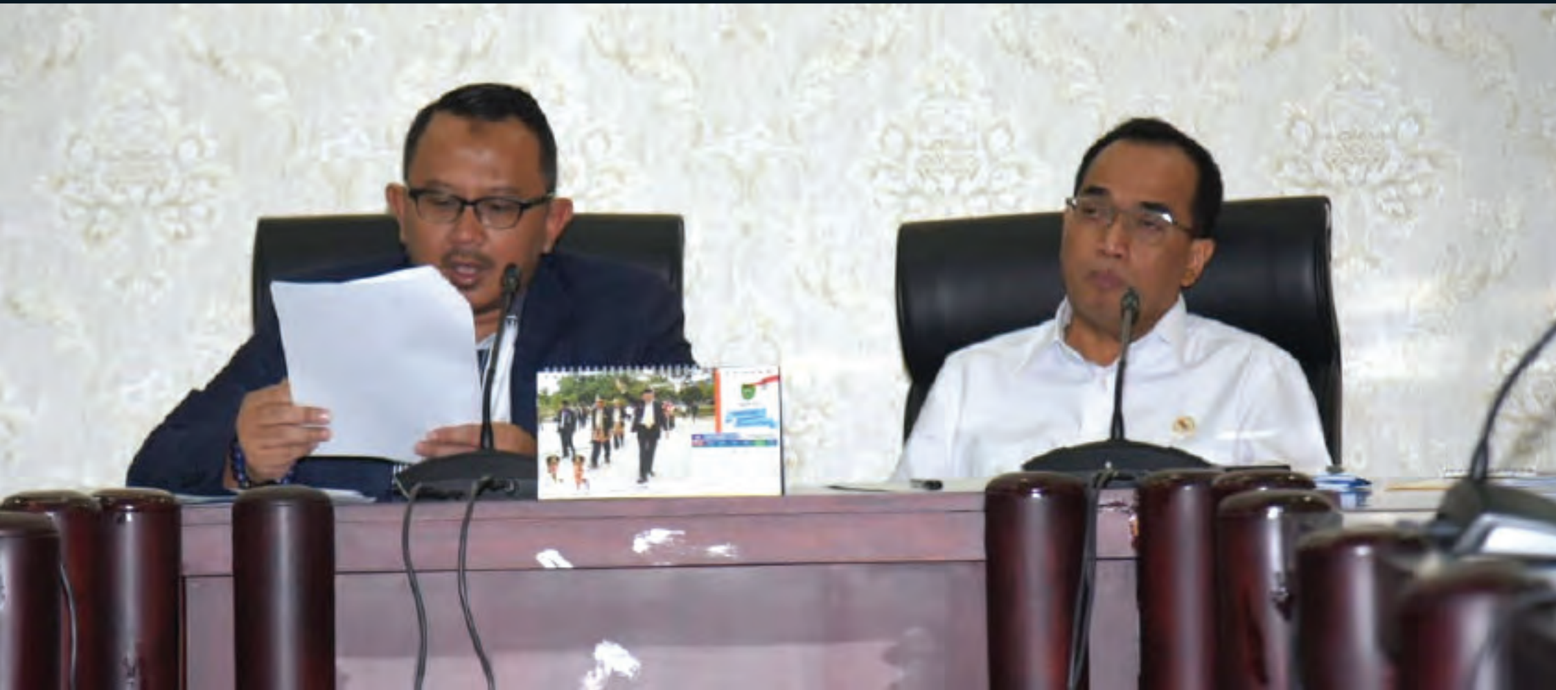
Pimpinan Komisi V Anton Sukartono Suratno bersama Menteri Perhubungan saat kunjungan di Sumatera Selatan terkait persiapan infrastruktur lebaran tahun 2019 24 Mei 2019