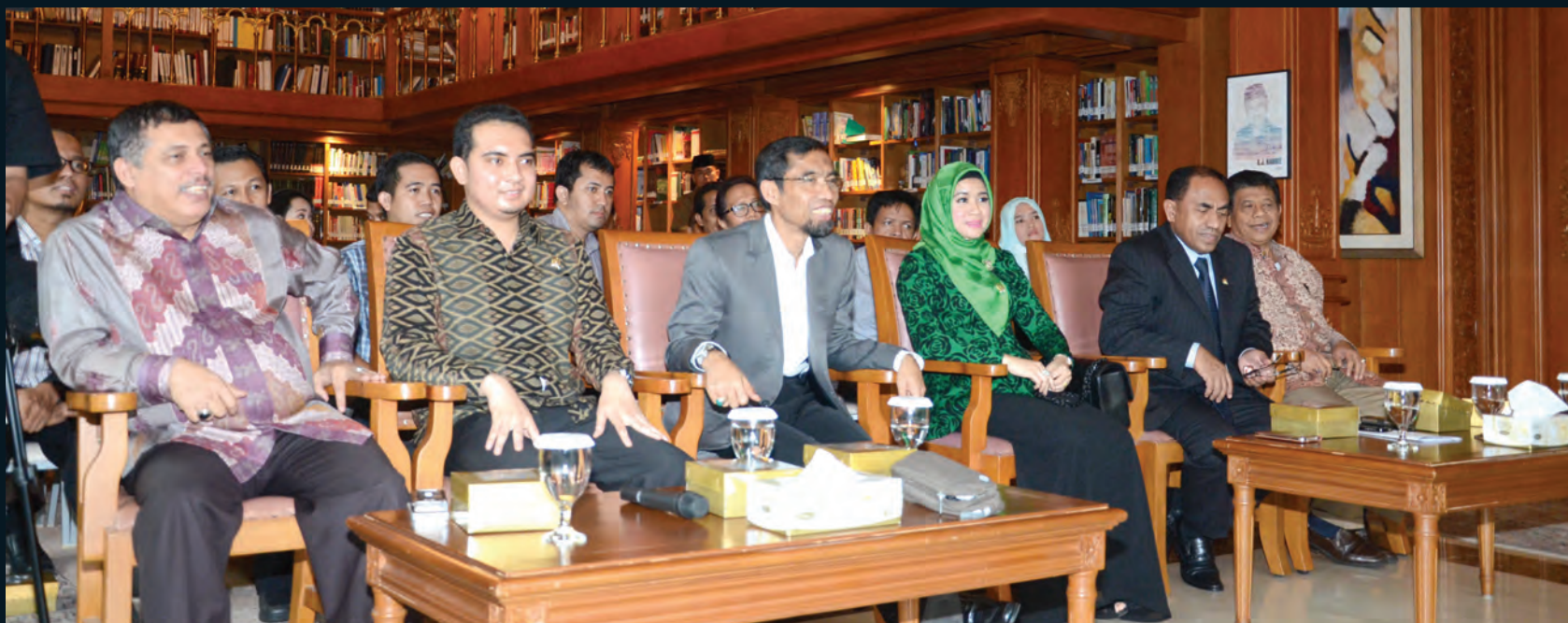
Kunjungan ke Habibie (Panja Penerbangan) Panja Keselamatan, Keamanan dan Kualitas Penerbangan Nasional meminta masukan ahli penerbangan antara lain Prof.Dr. B.J.Habibie. 18 Februari 2015