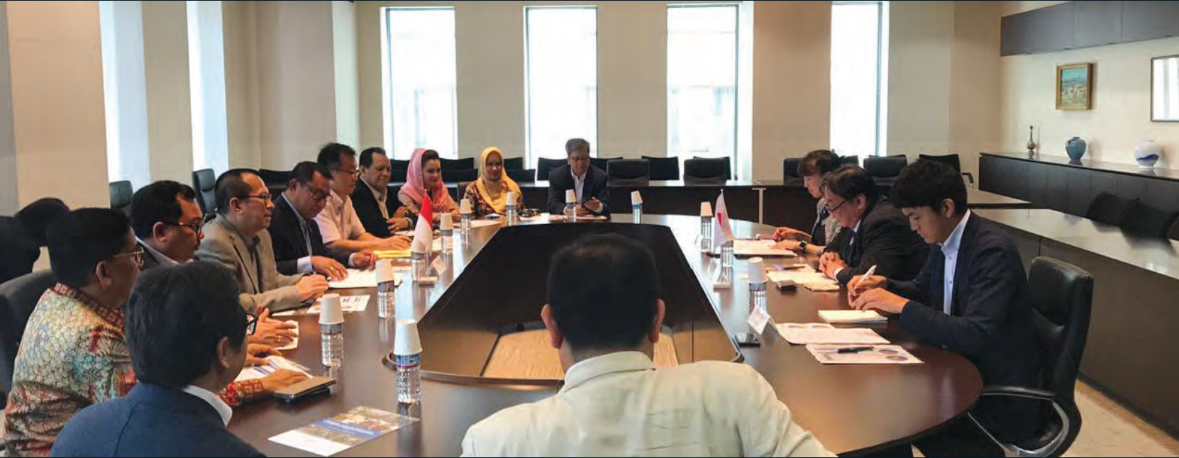
Kunjungan Kerja ke Jepang dalam rangka Revisi UU No.22 Tahun 2002 tentang Lalu Lintas dan Angkutan Jalan 09-15 Agustus 2015