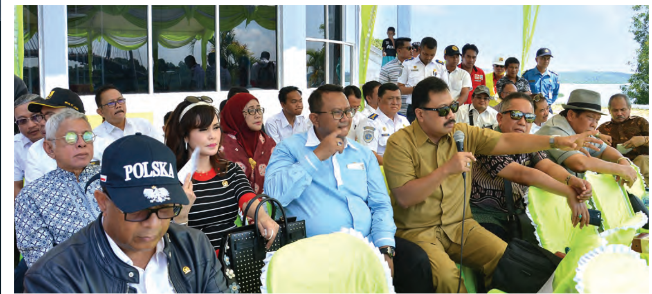
Kunspek Komisi V DPR RI ke Batam peninjauan Jembatan Barelang Kunjungan ke Batam ini dalam rangka Panja Pengelolaan Transportasi Darat Dan Preservasi Jalan Nasional Serta Jembatan Bentang Panjang. Panja ini diilhami antara lain runtuhnya jembatan Barito di Kalimantan Timur 22-24 Oktober 2017