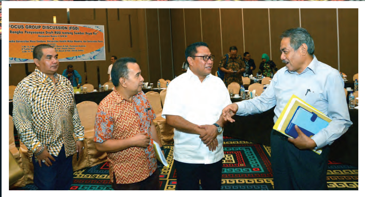
Rapat Komisi Komisi V DPR RI menerima masukan dari para akademisi Universitas Nusa Cendana, Universitas Katolik Widya Mandira, dan Universitas Flores pada saat FGD terkait RUU SDA di Kupang 03 April 2017