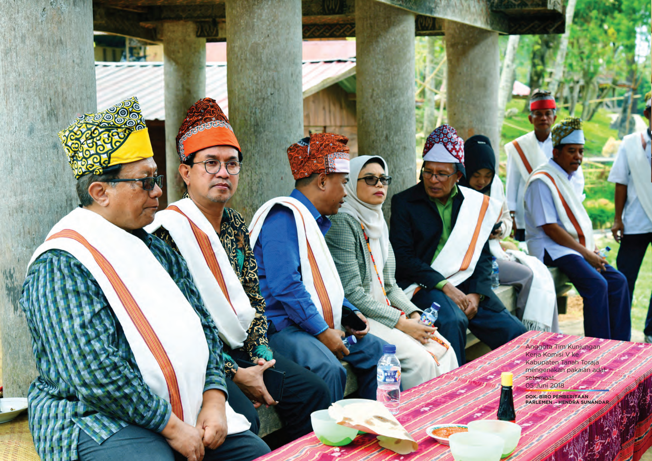
Anggota Tim Kunjungan Kerja Komisi V ke Kabupaten Tanah Toraja mengenakan pakaian adat setempat. 05 Juni 2018