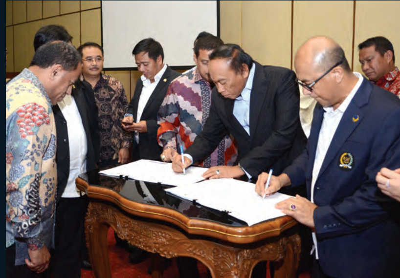
Raker Komisi V 2016 Komisi V DPR RI Pengesahan RUU Jakon dengan Menteri PUPR 07 Desember 2016