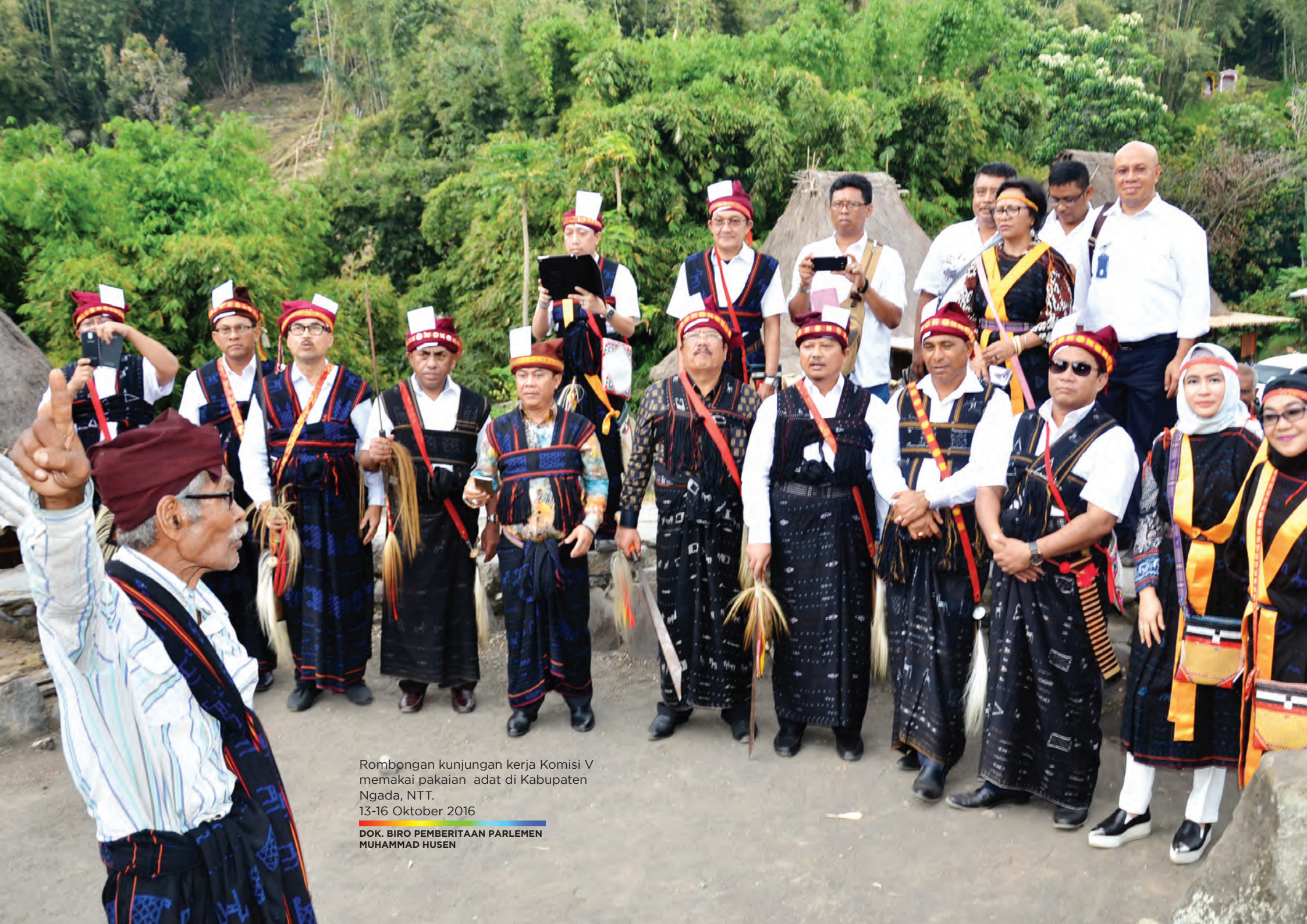
Rombongan kunjungan kerja Komisi V memakai pakaian adat di Kabupaten Ngada, NTT. 13-16 Oktober 2016