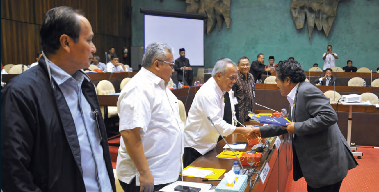
Rapat Komisi Komisi V DPR RI dan pemerintah mengesahkan RUU Arsitek 10 Juli 2017.