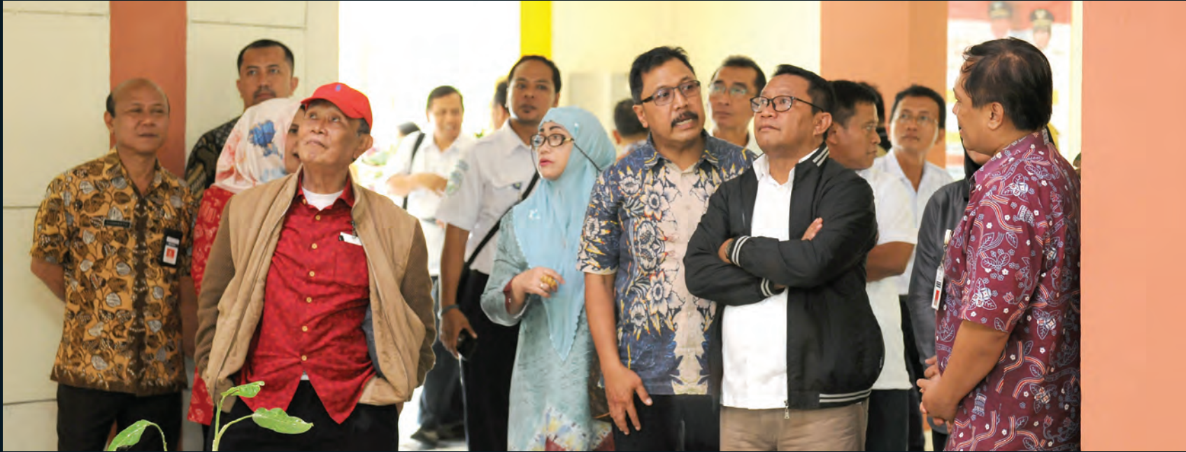
Komisi V DPR RI Kunspek ke Magelang, Jateng Peninjauan ke Rusunawa Potrobangsari 11 Januari 2018